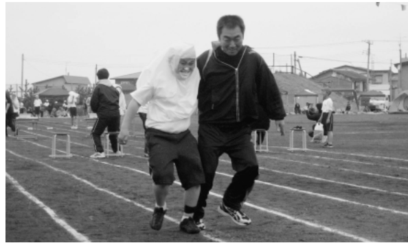
横浜小学校運動会 5月21日（土）