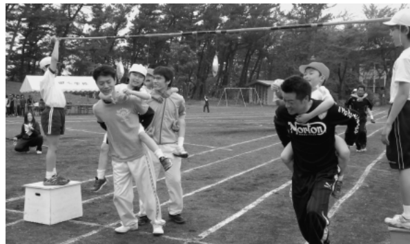
大豆田小学校運動会 5月21日（土）