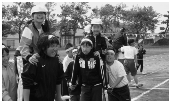
有畑小学校運動会 5月22日（日）