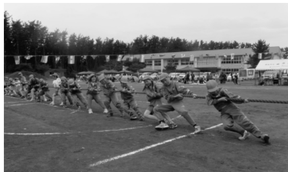
南部小学校運動会 5月22日（日）