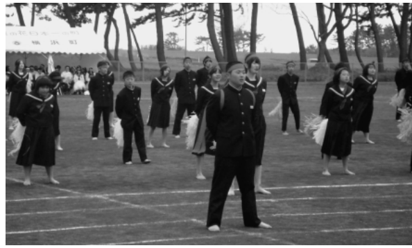
横浜中学校運動会 5月8日（日）