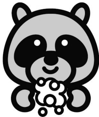
外出したあとは、こまめに、ていねいに手洗いを

せき、くしゃみなどの症状があるときは、きちんとマスクを。人にむかってせず、とっさに出そうときは、顔をそらして、ティッシュなどで口と鼻をおおいます。