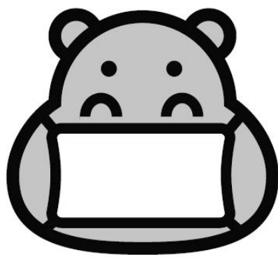
症状があるときはマスク、せきエチケットも必ず着用

せき、くしゃみなどの症状があるときは、きちんとマスクを。人にむかってせず、とっさに出そうときは、顔をそらして、ティッシュなどで口と鼻をおおいます。